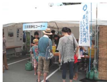
↑ 三河湾浄化の啓発活動

豊橋市には、豊川、梅田川、柳生川を始めとして105本の河川が流れており、東部山地及び南部台地を源とし、三河湾に注ぐ、水環境に大変恵まれたところ です。