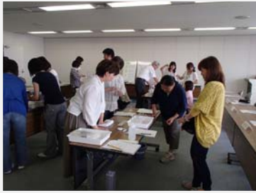
↑ 梅田川の水質調査

地域の生活排水対策の担い手として、生活排水クリーン推進員の皆さんが活躍しています。 今回は、豊橋市の取組をご紹介します。