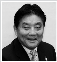
名古屋市長 河村 たかし氏

1948年名古屋市生まれ。一橋大学商学部を卒業後、1993年より衆議院議員を5期務め、2009年名古屋市長に就任し現在に至る。減税日本代表を兼務し、著書に名古屋発どえりゃあ革命!(ベスト新書、2011年)、名古屋から革命を起す!(家族で読めるfamily book series—たちまちわかる最新時事解説)(2009年)など。