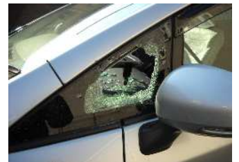
ガラスを割られ、被害にあった車