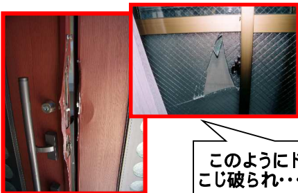
このようにドアや窓をこじ破られ...