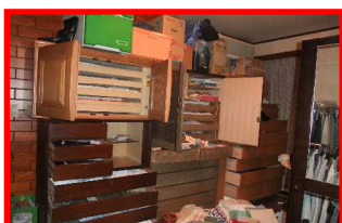
あらゆる引き出しを物色されてしまいます。