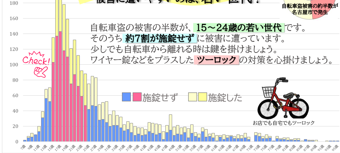
15～24歳 自転車盗 年齢別被害件数・施錠の状態 (愛知県:令和5年4月末)